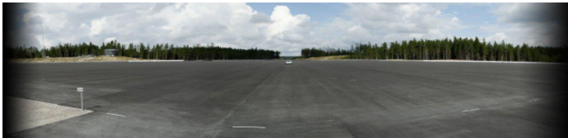
Asta Zeros testbana

AstaZero är en högteknologisk testanläggning i världsklass för utveckling av aktiv trafiksäkerhet. Anläggningen är ett framstående exempel på samverkan mellan akademi, näringsliv och myndigheter. I besöket ingår en guidad busstur på anläggningen och tillfälle att se exempel på aktiv fordonssäkerhet i praktiken.