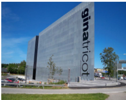
Gina Tricots huvudkontor

På kvällen bjuds här på god mat, trevligt sällskap och underhållning.